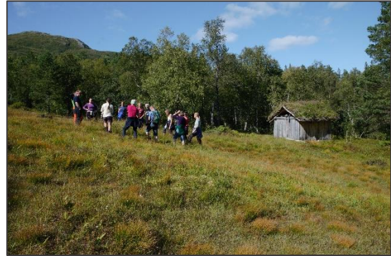
Figur 5: Slåttemyra på Ytste Skotet.

dagar hesja ein slåtten. Dei som slår i dag tykkjer vekstrane er for korte til å hesja og lurar på om avlinga tidlegare var større. Det er også restar etter dreneringsgrøfter. Ein kjenner også til at det er teke ut torv.