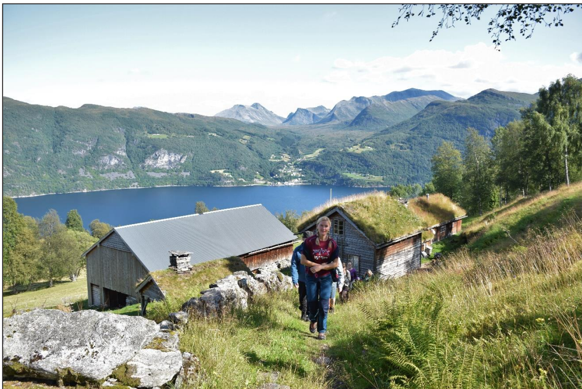
Figur 6: Øvst til venstre: Solblomen som tidlegare i sommar lyste gul på myra var no avblomstra. Øvst til høgre: Nokre av landskapspleiarane på Skotet. Nedst: Gjengen på veg opp til myra med Ytste Skotet i bakgrunn.