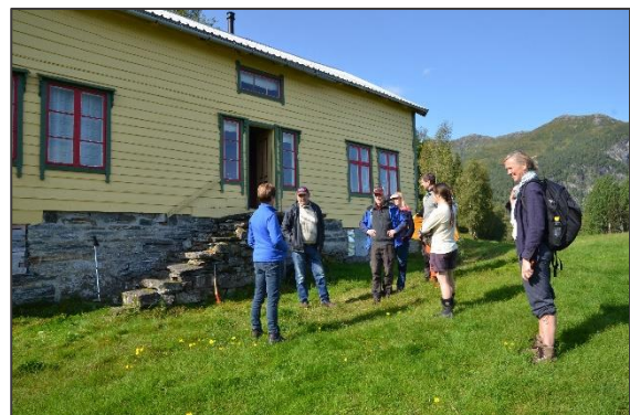
Figur 4: Me-Skotet