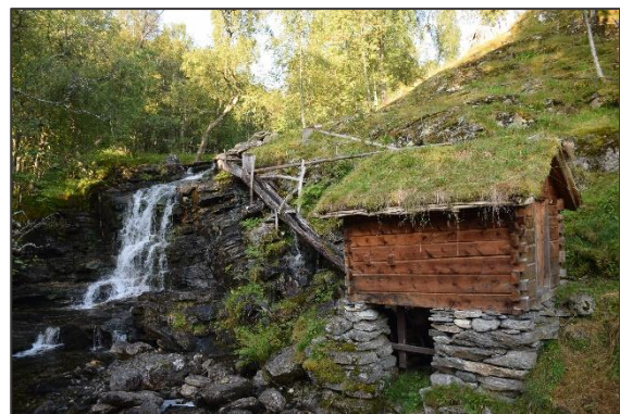
Figur 2: Ovan: Nedanfor tunet ligg ei flat hylle der ein tidlegare dyrka korn og poteter. I dag vert innmarka slått. Nedan: På veg til Me-Skotet gjekk vi forbi elva med kvern etc.