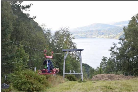
Figur 1: Den motoriserte taubana vart bygd på 1940-talet og er framleis i bruk.

er elles kyrkjebøkene som viser at det budde folk her på 1600-talet. Ytste Skotet vart fråflytta i 1954.